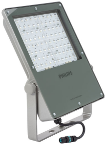
Coreline tempo large-BVP130